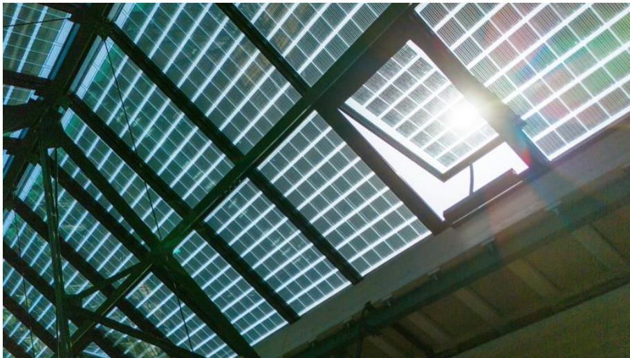
LAMILUX Glasdach PR60 vereint Tageslicht, Energiegewinnung und Wärmeschutz