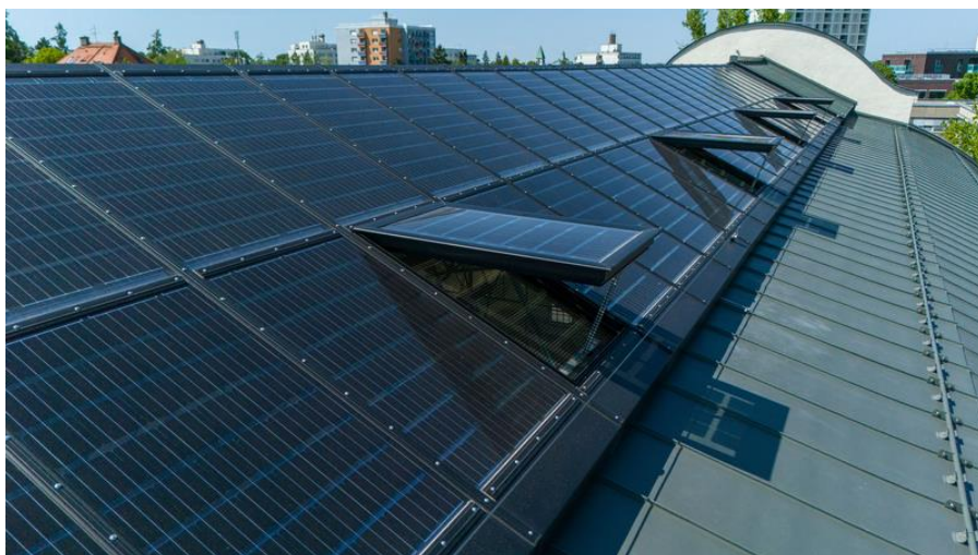
Photovoltaikmodule in der Verglasung des LAMILUX Glasdachs PR60